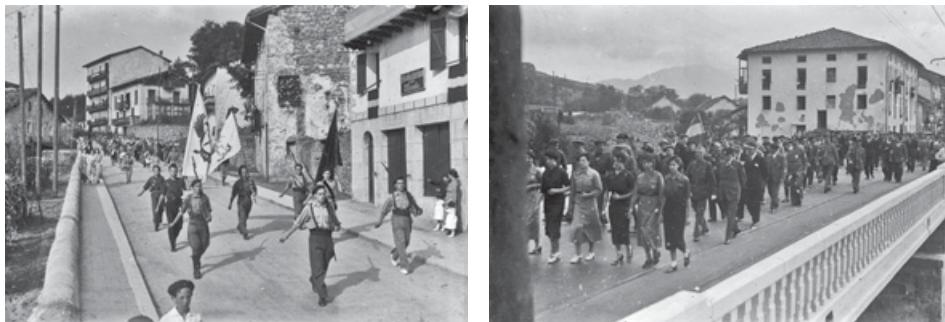
46-47. irudiak. Andoain nazionalak hartu zuteneko bi irudi, eskuinekoa, Nafarroako zubia inauguratu zenekoa (1937).

Ilustración 46-47. Dos imágenes de la toma de Andoain por los nacionales; la de la derecha, de la inauguración del puente de Navarra (1937).