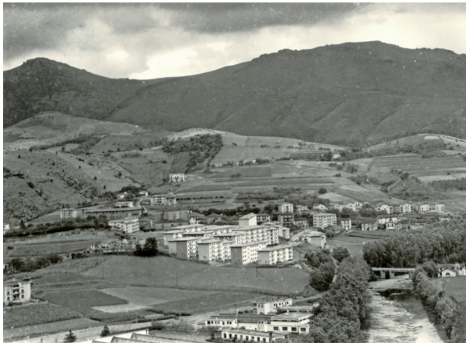
49. irudia. Andoain 60ko hamarkadan.

Ilustración 49. Andoain en la década de los 60.