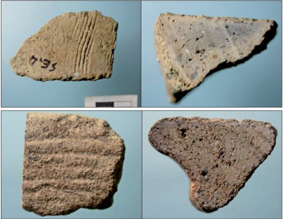
15. irudia. Goiburuko San Esteban aztarnategian aurkitutako zeramikaren zatiak 85 .

Ilustración 15. Fragmentos de cerámica de época romana hallados en el yacimiento de San Esteban de Goiburu 85 .