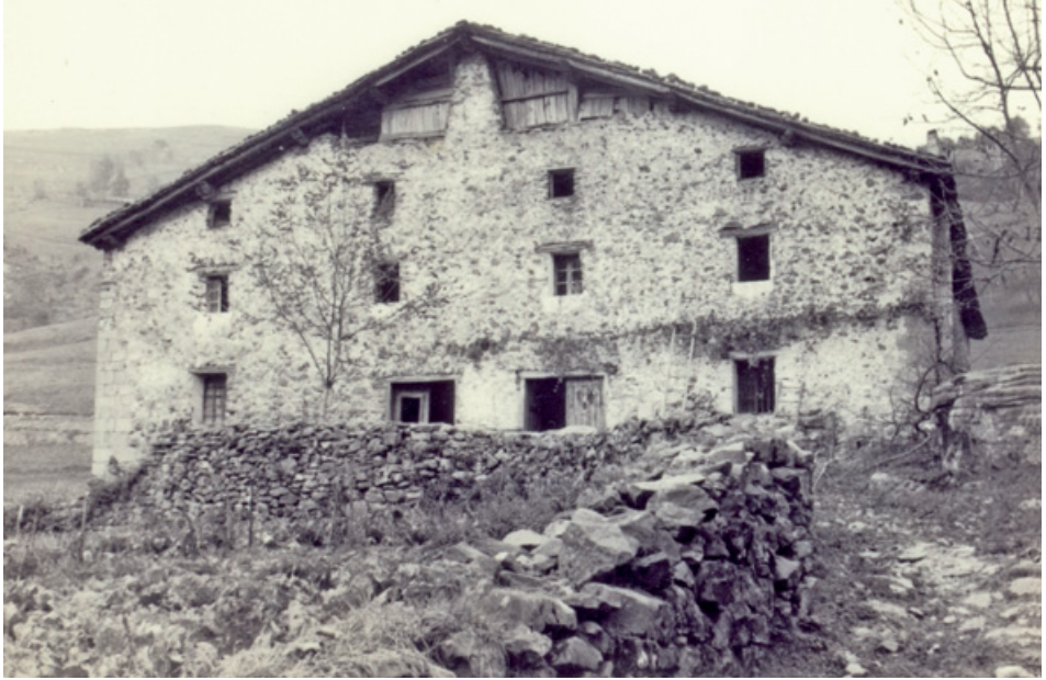
21. irudia. Urrillondo baserria, garai bateko burdinola.

Ilustración 21. El caserío Urrillondo, antaño ferrería.