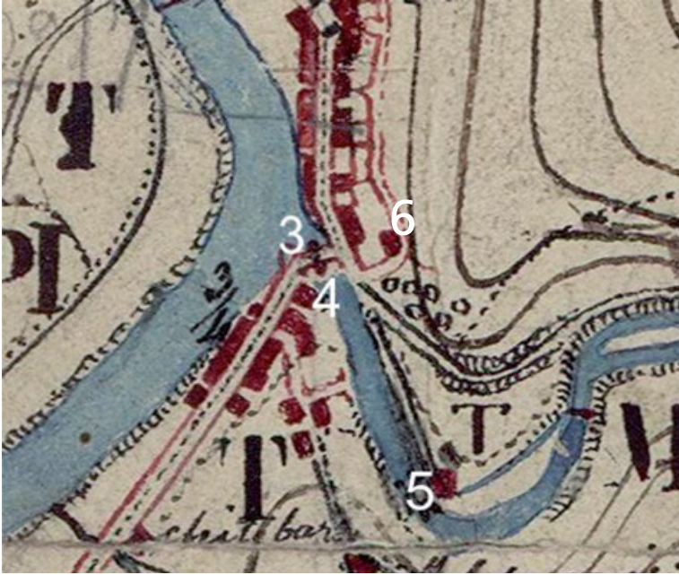
19. irudia Leizaur multzoa. Madrildik Irunerako ibilbidea Burgos eta Gasteizen barrena, xehetasuna (3. Santa Krutz zubia, 4, Santa Krutz eliza, 5, Leizaur burdinola, eta 6. Leizaur dorretxea).

Ilustración 19. Aglomeración de Leizaur. Detalle del Itinerario topográfico de Madrid a Irún por Burgos y Vitoria (Se señalan con el número 3: el puente de Santa Cruz, con el número 4, la iglesia de Santa Cruz, con el número 5 la ferrería de Leizaur y, con el 6, la casa torre Leizaur).