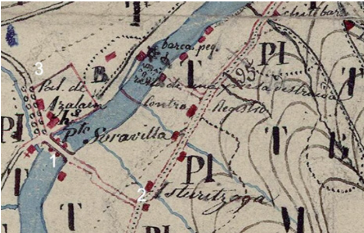
18. irudia. Zumeako multzoa. Iturria: Madrildik Irunerako ibilbidea Burgos eta Gasteizen barrena, xehetasuna (Andoaindik igarotzen zena). 1849 (1. zenbakia, Azelain zubia, 2. Isturizaga dorretxea, 3. Sorabilla).

Zumea era la que se localizaba más al sur del territorio, la más cercana a Amasa y Villabona. Sus edificios se levantaban en la margen derecha del río Oria. En sus proximidades se encontraba el puente de Azelain que unía esta zona con la de Sorabilla, un núcleo de población que todavía en esta época no formaba parte de Andoain sino de la Alcaldía Mayor de Aiztondo (Ilustración 18). Las fuentes documentales mencionan que los habitantes de Zumea estuvieron en un principio bajo el control del Señor de San Millán de Zizurkil, un importante Pariente Mayor. Se desconoce en qué momento Zumea dejó de estar bajo la influencia del Señor de San Millán. Pero en la segunda mitad del siglo XV, tal y como se puede leer en los manuscritos de la época, sus vecinos formaban parte de la tierra de Andoain 96 .