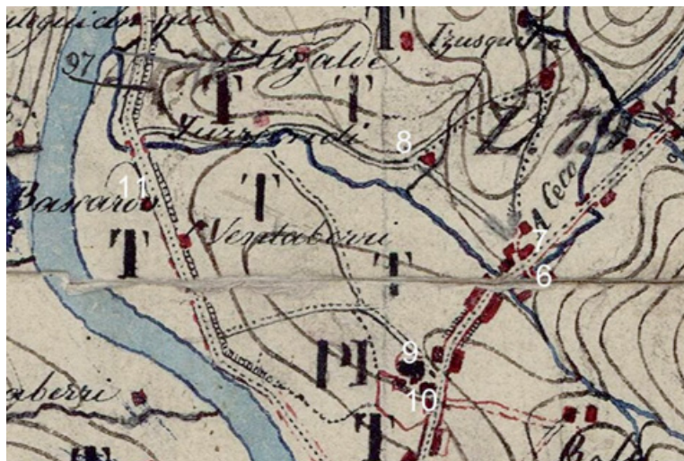
20. irudia. Andoaingo multzoa. Madrildik Irunerako ibilbidea Burgos eta Gasteizen barrena, xehetasuna (6. Berrozpeko zubia; 7. Berrozpeko dorretxea; 8 Buruntzako San Martín eliza; 9, gaur egungo Goikoplazako San Martín; 10. Udaletxea; 11. Bazkardo dorretxea).

Ilustración 20. Aglomeración de Andoain. Detalle del Itinerario topográfico de Madrid a Irún por Burgos y Vitoria (Se señalan con el número 6: el puente de Berrozpe, con el número 7, la casa torre de Berrozpe, con el número 8 el entorno de la iglesia de San Martín de Buruntza, con el número 9, la actual iglesia de San Martín, con el número 10 la actual casa consistorial y el número 11, la casa torre Bazkardo).