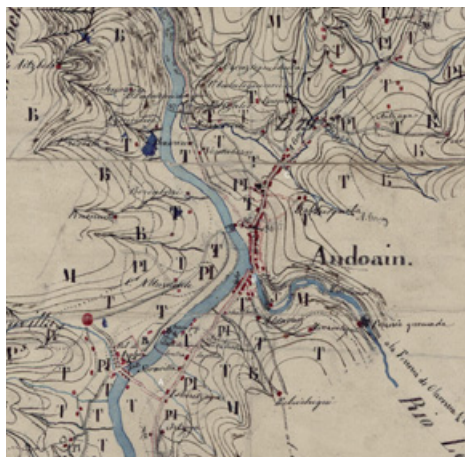
17. irudia. Madrildik Irunerako ibilbidea Burgos eta Gasteizen barrena, zati berriarekin, Andoaindik Donostian barrena igarotzen zena, Errenteritik Astigarrako Bentako mendatera eta Oiartzunera igarotzeko. 1849. (A. letrarekin Zumea zonaldea, B, Leizaur eta C Andoain markatzen dira).

Ilustración 16. Croquis de la línea enemiga establecida por el ejército carlista en la inmediaciones de Andoain. Fuente: Documentos cartográficos históricos de Guipúzcoa II. Servicio Histórico Militar . Año 1840.