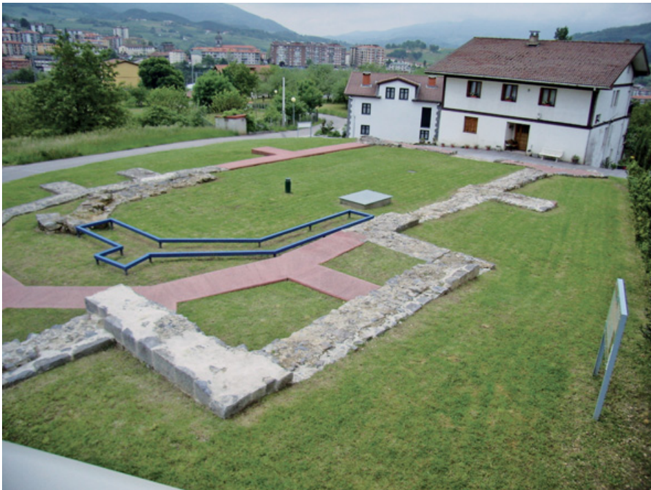
22. irudia. Gaur egun, Buruntzako San Martin eliza kokatzen zen lekuan parke arkeologikoa eratzen da.

Durante la Edad Media el templo de San Martín se localizaba en las faldas del monte Buruntza, en el entorno donde actualmente se encuentran los caseríos Elizagarate, Elizalde y Serorategi. La realización de varias intervenciones arqueológicas ha corroborado su existencia en dicho lugar. Y es gracias al estudio arqueológico como se ha constatado una evolución en las dimensiones y formas del edificio. La primera referencia documental sobre la iglesia de San Martín de Andoain (Buruntza) data de 1350. En este año, el obispado de Pamplona realizó un listado de las parroquias adscritas bajo su jurisdicción. Este recuento de templos parroquiales era una forma de censar y controlar a la población obligada a pagar los diezmos. El diezmo era la fuente básica de ingreso para la Iglesia. Se trataba de un tributo abonado de forma anual por los fieles para mantener el templo, el culto religioso y el sustento de los clérigos. Consistía en el desembolso de la décima parte de la producción agropecuaria, en grano, frutos y ganado, de cada uno de los feligreses. Esta contribución por parte de los fieles se entendía como el reconocimiento del dominio de Dios, por ser él quien concedía las cosechas y las protegía de todo tipo de plagas, así como por los servicios y oficios religiosos que recibían por parte del clero.