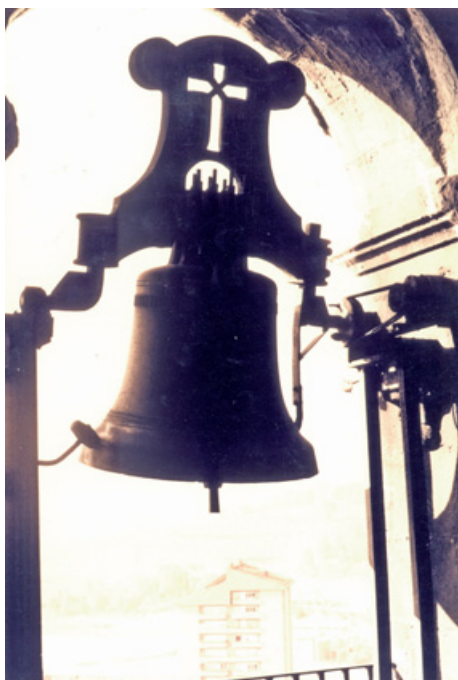
23. irudia. Erdi Aroan eta Aro Modernoan kanpai-jotzeak jendea biltzen zuten.

familiantzat eliza botere-gune bat zen, jendartearen mentalitatea bereganatu eta beren eragina zabal zezaketen tokia. Ebanjelioetako idatziak jakitera eman ez erlijio kristauak esaten zion jendeari zer egin eta zer ez egin, nola jokatu behar zuten eta nola ez. Horrela, zer zegoen ondo eta zer gaizki egin mugatzen hasten zen; noski, eliztarrek mezua ez zuten zertan guztiz onartu lehengoetan, baina beti zegoen atea irekita damurako eta aitortzarako, eta ondorioz barkatua izatekoa ere.