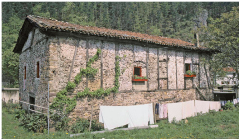
27. irudia. Olaberria baserria, herriko ondasuna.

Ondasun komunei dagokienez, beroriek ziren herritarren probetxurako, eta horrek esan nahi zuen, printzipioz, erabilpen librekoak zirela. Hiribildu guztiek, tamaina batean edo bestean, arautu zuten ondasun mota horien erabilera; eta, araugintza bidez, kontzejuak administratu zituzten ondasun komun batzuk propioak balira bezala, aldi baterako zenbaitetan eta betiko besteetan. Andoainen, kontzejuaren finantza-beharrak zirela eta, ondasun batzuk erregimentuaren kudeaketapean ipini ziren, eta erabiltzen hasi propio gisa. Esate baterako, XVII. mendean, kontzejuak errentak eskuratzen zituen zenbait madariondoren fruituen urteko akurapenarengatik, baita gaztainondoengatik ere. Errekabeltzekoak eta Igerola edo lerolakoko bailarakoak (Zumea bailan eta Recabeltz) 326 .