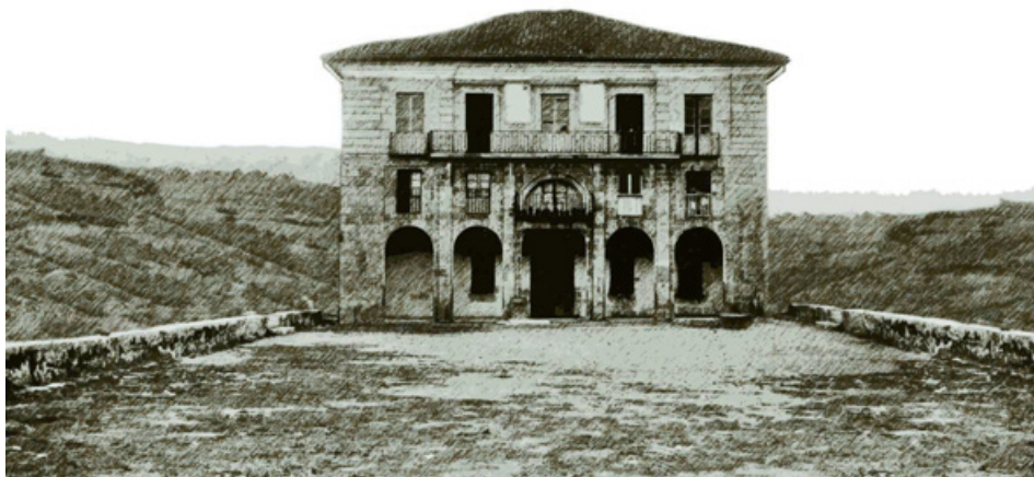
26. irudia. Herriko etxea eraiki zen Andoain hiribildu titulua lortu ondoren.

hiribilduetan erregimentua biztanleen ordezkaritza bereganatuz joan zen, batzar orokorrak pisua galduz joan ziren bitartean, biztanle guztien ordezkari gisa; baina, Andoain bezalako hiribildu txikietan, badirudi udal orokorrak edo batzarrak jarraitu zuela izaten tokiko erkidegoko ordezkarien organo nagusia 257 .