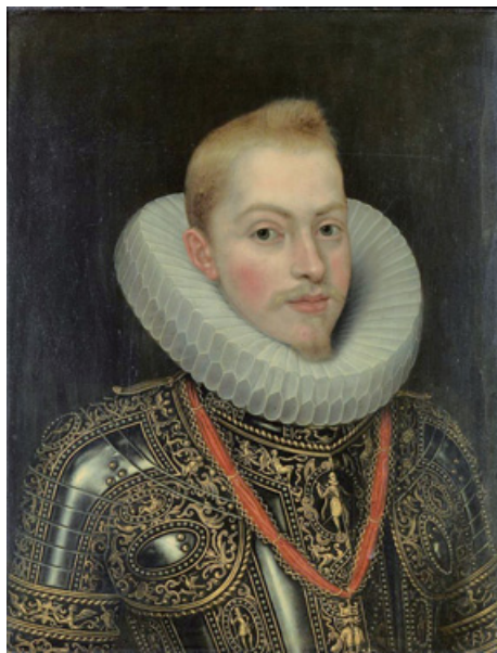
25. irudia. Felipe III erregeak hainbat hiribildu titulu eman zuen bere erregealdian, Andoaingoa barne.

Gortean, gehien zerabilten burubidea arrazoi ekonomikoak ziren, eta horrek makurtu zuen balantza herrien aldera; izan ere, azkenean, erregeak auzotar bakoitzeko 25 dukat jar zituzketenak hiribilduarekin mesedetu zituzten 218 . 1615eko