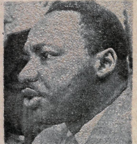
Martin Luther King