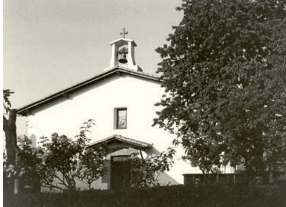
Ermita de San Esteban de Goiburu.

Villas que se independizaron de Tolosa, Segura y Ordizia en 1615. También los habitantes de Urnieta compraron el título de villa.