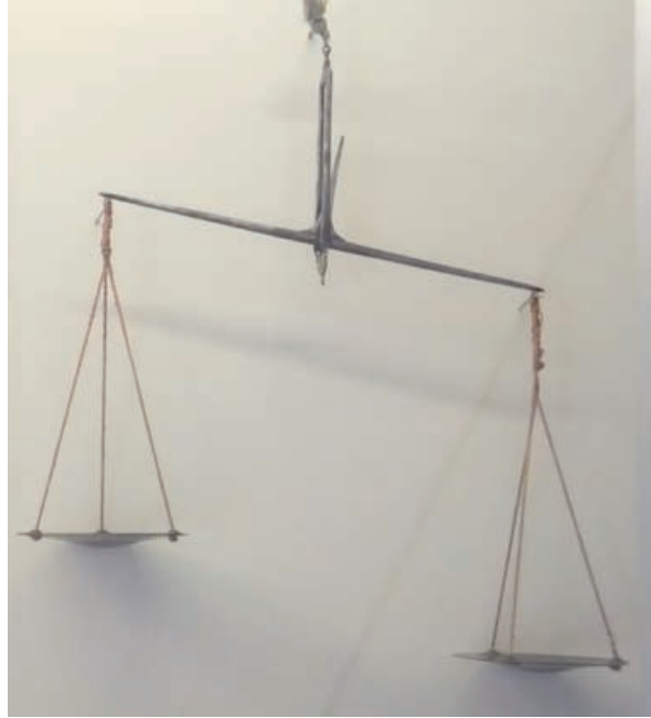
Fuente: Guerrit Dou. El pesador de oro, 1664.

El mecanismo habitual que se había utilizado en toda Castilla desde el reinado de Carlos I para solucionar estos problemas era que los habitantes de la aldea compraran al rey el título de villa.