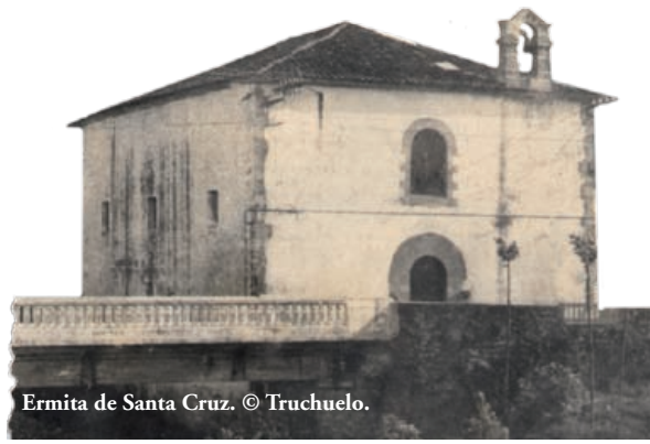
Ermita de Santa Cruz.

las dichas aldeas son más antiguas que las dichas villas porque las dichas villas se fundaron en caserías de las dichas aldeas.