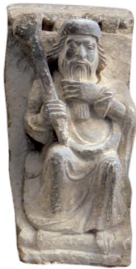
Imagen del alcaide con la vara de justicia. Relieve de la iglesia de Santiago en Carrión de los Condes.

En los primeros años de andadura de la nueva villa de Andoain, siguió vigente el sis-