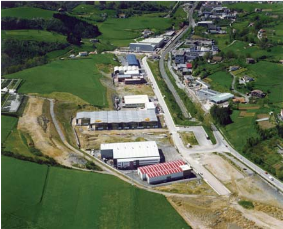
Leizotz industrialdea aurkitzen den Gudarien Etorbidearen ikuspegi orokorra, bertako azpiegitura antolatzen 2000. urtean.

Arau Subsidiarioak indarrean zeudela, etxebizitza eraikuntza geldoa izan zen aurreko hamarkadekin alderatzen bada, seguruenik hirigintza praktika neurtuak izan nahi zutelako, momentura arteko neurrigabeko praktikek eragindako hiri-ehunarekiko kalteak berriz ez errepikatzeko asmoz. Kontuan izan behar da, halaber, 1982an Arauen aldeko hautua egiten denetik, poligonoetako urbanizazio prozesuen gehiengoak amaitzeko zegoela oraindik, izan ere, prozesu hauetariko asko 90. hamarkadara arte bezala, XXI. mende hasierara arte luzatu ziren; 60. hamarkada amaieran urbanizatzeari ekin zitzaion 17 poligono problematikoa kasu. Bada, Arauen hiri-antolamendurako diskurtsoa azpiegituren lanketatik zihoanez, esparru hau garatzera bideratu zen oro har garaioko hirigintza.