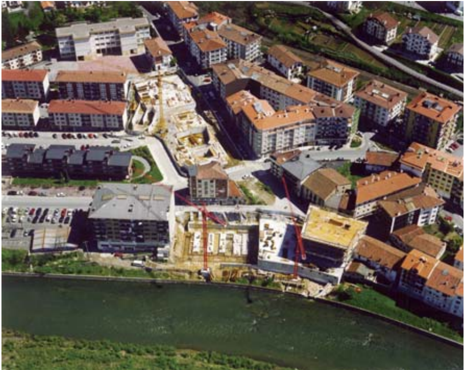
Andoaingo erdigunearen ikuspegi orokorra 2000. urtean, etorkizuneko Bastero Kulturgunearen obrak martxan zirela. Kontuan hartu behar da, bederen, hiri-ehunarekiko lanak XXI. mende hasierara arte luzatzen direla, eta jada 2004rako idazten zeudela 2011an onartuko zen Plan berria.

Arau Subsidiarioak ordezkatzeko zituen hiri antolamendurako idatzi berria 2004an prestatzeari ekin zion Gurbain S. L. enpresak, eta 2007an jaso zuen lehen onespena proposamenak. Hala ere, 2009ra arte ez zaio behin-behineko onespenez izaera aitortzen txostenari, eta ez da izango 2011 arte, halaber, behin betiko onarpena jasotzen duela Hiri Antolamendurako Plan Orokor berriak. Izan ere, Planak PSE-EE eta PP alderrien aldeko botoekin soilik kontatu zuen, garaiko Udal Batzarrean zuten gehiengo baliatuz aurrera atera zutena 94 . Arauetako diskurtsoan ez bezala, idatzi berriari urbanizatzeko lur gehiagoren beharra sortzen da «udalerraren premiei erantzunez». Horretarako, Andoain txertatzen den eskualdea hartzen du kontutan testuak, udalerraren habitatzeko errealia islatzen ez duten datuak aurkeztuz eta hauekiko garapen urbanistikoa garatzea ezinbestekoa dela aldarrikatuz.