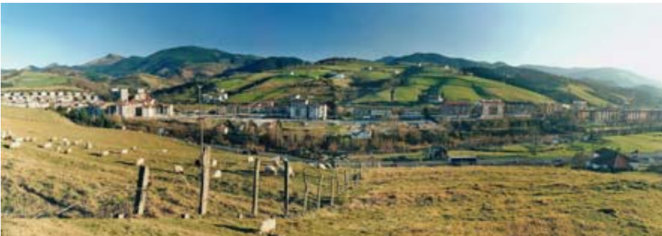
Hirigunea eta zabalgunearen artean zegoen azpiegitura eza islatzen duen 2009ko argazkia, Zumea eta Etxeberrieta auzoetako etxebizitza berriak eraiki ziren arte, ekipamendu publikorik izan ez zuen eremuan.