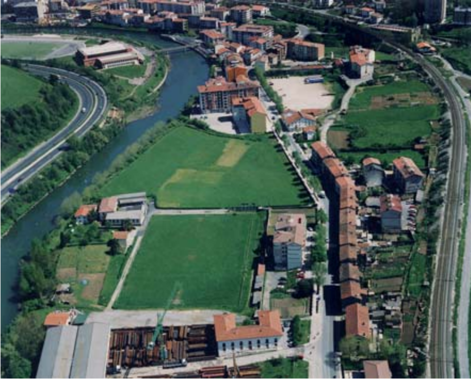
Zumea eta Etxeberrieta auzoen ikuspegi orokorra 2000. urtean, auzoen arteko higikortasuna N-1 errepide zaharrak ahalbidetzen zuen.