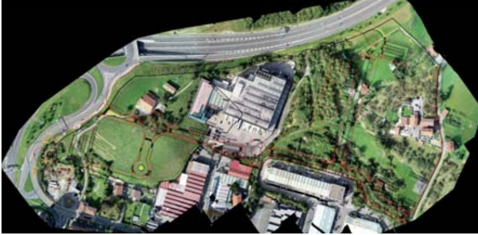
Merkataritza-guneak izango duen zabalera irudikatzen duen planoak; Illarramendi baserria eraitsi aurretiko argazkian. Iturria: online. Urbanización polígono Illarramendi (2021/07/15).