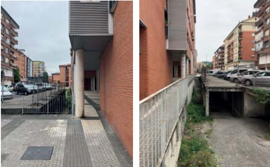
Espazioaren ikuspegi orokorra gaur egun, oraindik bere garaian kokatutako behin-behineko harresia mantentzen da errepide altueran. Norberaren argazkia (2021/07/29).