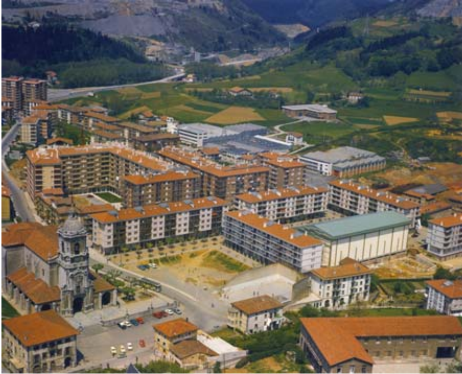
17 poligonoaren ikuspegia eraikitze lanetan, frontoia, Eliza eta Udaletxea setiaturik ematen dute. Iturria: A.U.A., F.7.5/226. © Paisajes Españoles (1977).