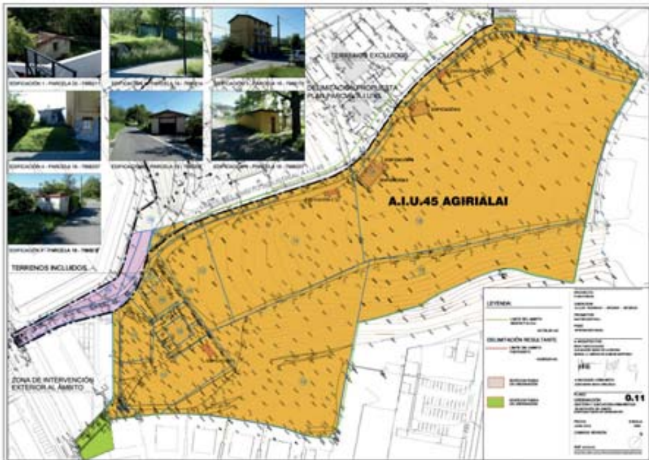
Agirilai ingururako aurreikusita dagoen etxebizitzaren eraikuntzak hartuko lukeen espazioa; ikusi daitekeenez, merkataritza-gunearekin bat egingo luke mendebaldean. Iturria: A.I.U. 45 "Agirilai", Documento 1, Memoria, Balfer Norte, S. L., 2019.