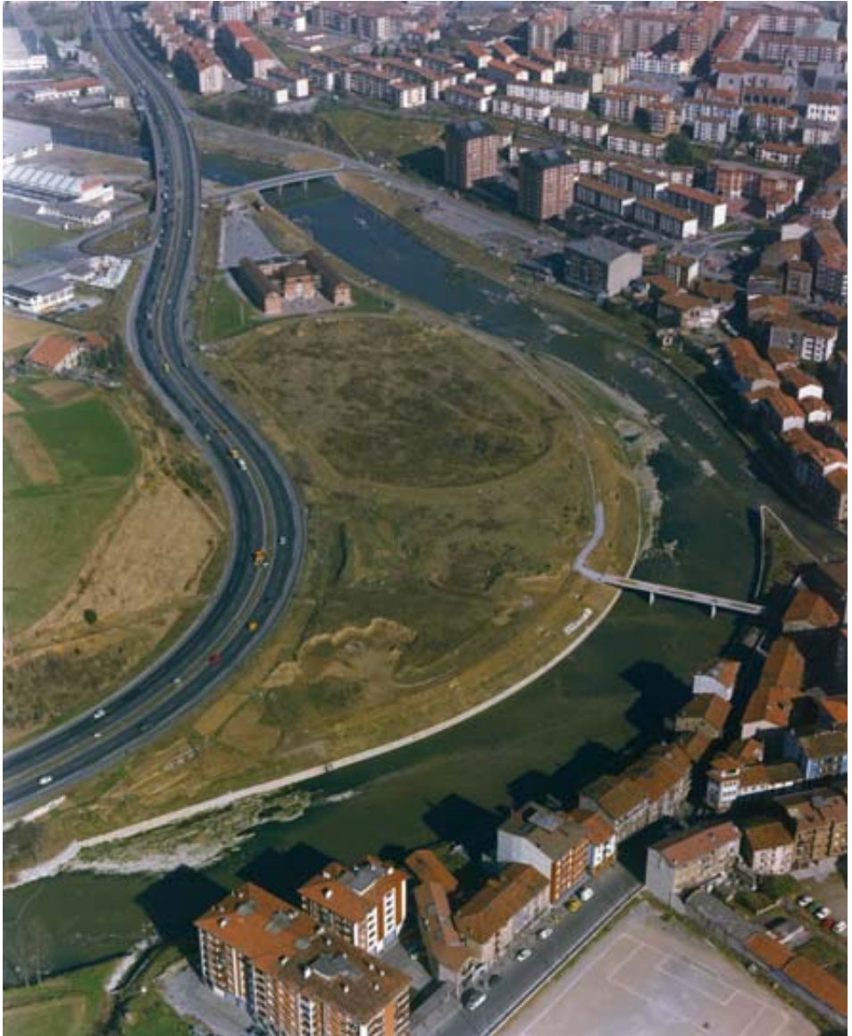
Ekipamendu publikora bideratutako 43 poligonoaren ikuspegia, 1989ko argazki honek etorkizuneko kiroldegiaren obra lanen hasiera islatzen du.