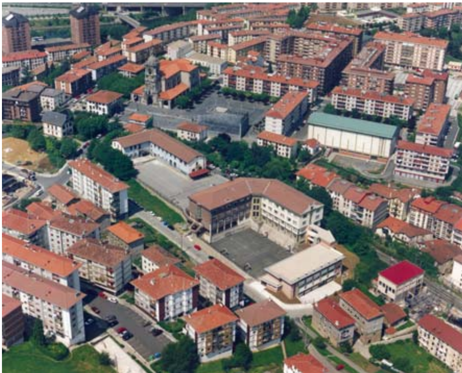
Oinezkoentzat prestatutako Goikoplazaren ikuspegia.