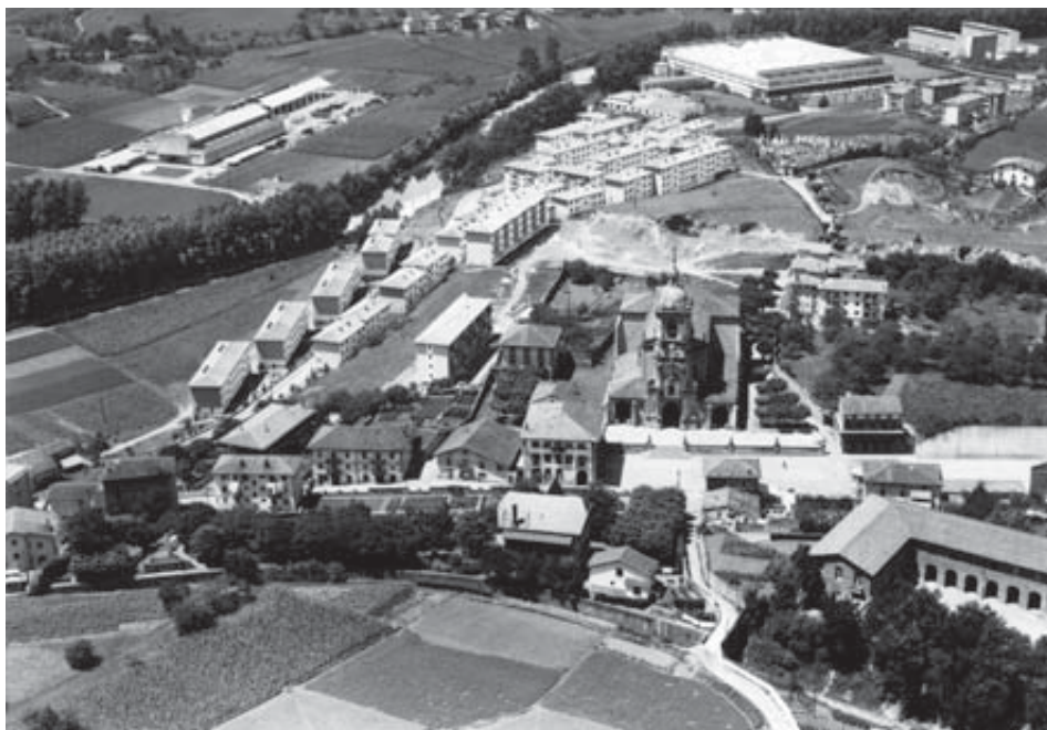
Udaletxea, Eliza eta hilerria aurkitzen diren muinoa, eraiki berri zen Larramendi etxebizitza multzoarekin batera.

Andoaingo kasuan ere, hirigintza antolamenduarekiko norabide aldaketa nabarrena antzeman daiteke lege honen aplikazioaren ostean. Bada, 1955ko antolamendua bertan behera geratzearekin batera, udalerrria poligonoen —definitutako orubeen multzoa— arabera antolatu zen. Horrela, udalerrian garatu zen hiritartze eredua poligonoak urbanizatzerara bideratu zen, hauen ekipamendu eta okupazio isolatura, alegia; kontuan hartu gabe aurreko Plan Orokorrak iradokitzen zituen ekipamendu publiko eta azpiegituren eraikuntza. Horretarako, 1961an Isidro Setienek poligonoen bitarteko banaketa zehaztu zuen, Jarduketa Programa baten erredakzioarekin batera. “De esta forma se inicia un proceso en el que se varían los parámetros de la propuesta urbanística inicialmente planteada para Andoain. El planteamiento no va a servir sino para el desarrollo y ocupación de los polígonos, olvidando que para la constitución de la trama urbana es preciso la creación paralela de la red viaria, las infraestructuras y el equipamiento, (...)” 73 . Orain arte aipatu diren lehen etxebizitzaren eraikuntza, 1955an proposaturiko zabalgunetik urrun, iparraldera geratzen den muinoan eman da, Aita Larramendi etxebizitzak kasu, orubeen aurretiko egoeraren zein etorkizuneko eraikinarren inguruarekiko talkaren azterketarik egin gabe gehienetan.