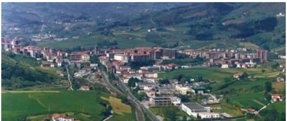
Eraikin askoren gehiegizko altueragatik, iparraldeko muinoan aurkitzen diren eraikin sinbolikoak estaltzen ditu etxebizitza eraikin-sare batek. Argazkian, Bazkardo, 17 eta 25 poligonoekin batera muinoan inguratzen.

Planteamendu honekin, udalerriko etxebizitza eskaintzak sustatutako demografia hazkundera aldirietarako eremu marjinaletara lekualdatu zen, topografikoki aproposak ez izatearekin batera, irisgarritasun arazo larriak zituzten eremuetara. Izan ere, plan partzialetan oinarritutako eraikuntzok aurretik zeuden azpiegiturretan oinarritzen ziren, baina etorkizunera begira, gorantz zihoan dentsitate urbanoak bideraezin egingo zituen. Era berean, Plan Orokorrek zehaztutakoa urratzeko malgutasuna eskaintzen zuen hiritartze eredu honek, eta horren adibide garbia da garai honetan hiriguneara eraikitzen diren etxebizitzaren gehiegizko altuera, adibidez.