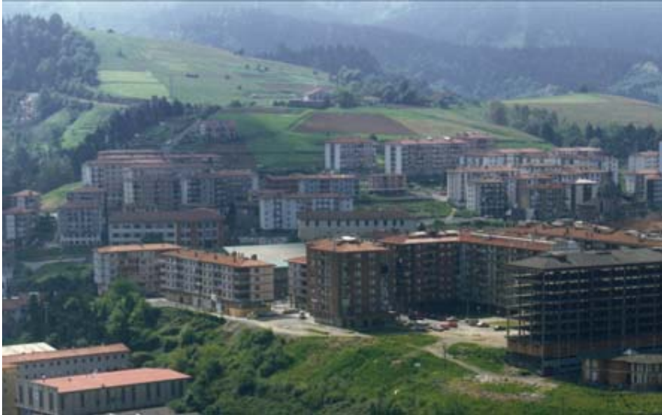
Atzealdean, 25 poligonoaren ikuspegia Bazkardotik, aurrean, 17 poligonoa obretan.