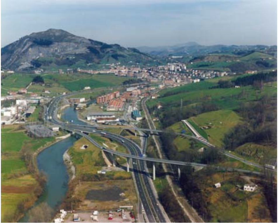
Nafarroako autobiaaren ikuspegia. Iturria: A.U.A., F.7.5/243. © Paisajes Españoles (1996).