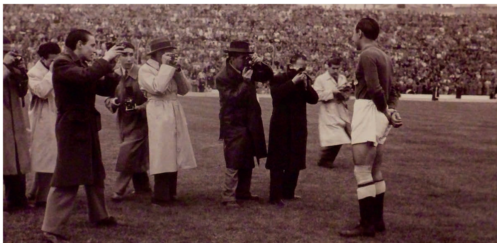
La vuelta de Langara (10 noviembre 1946). Metropolitano. Club Atlético Aviación-Real Oviedo.

Mexicana en la temporada 1943-44, anotando 27 goles en 18 partidos.