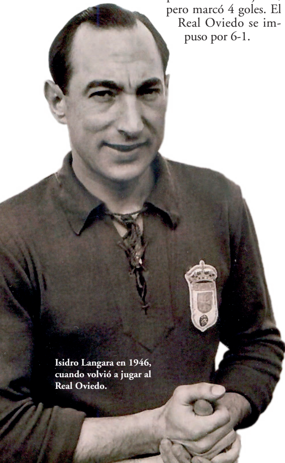
Isidro Langara en 1946, cuando volvió a jugar al Real Oviedo.

Los aficionados estaban emocionados y deseosos de disfrutar viendo jugar a Langara de nuevo, por lo que el club organizó un partido amistoso contra el Racing de Santander. El partido se jugó el 15 de septiembre, una semana antes del inicio de la liga. El Estadio de Buena Vista estaba completamente lleno y Langara no decepcionó. Ya no era joven, pero marcó 4 goles. El Real Oviedo se impuso por 6-1.