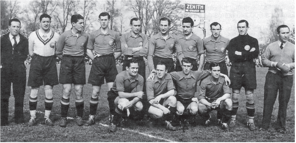
La Selección Euzkadi de gira en la URSS (1937).

enviando la pelota lejos de la portería. No quería marcar y ganar el partido con un penalti discutible. El partido terminó en empate 3-3.