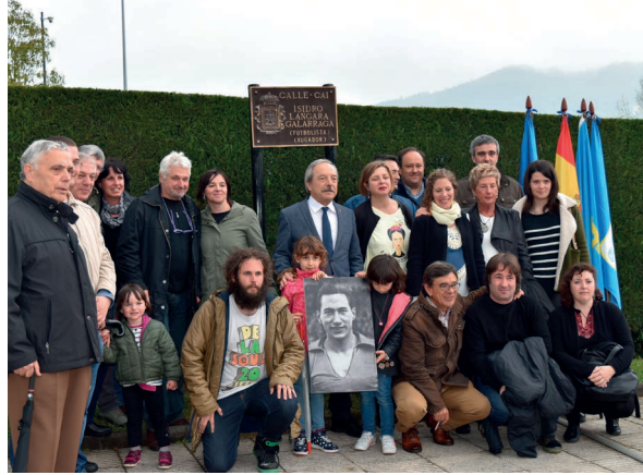
Familiares y representantes del Real Oviedo delante de la placa con el nombre de Isidro Langara en una calle de Oviedo (15/05/2016)