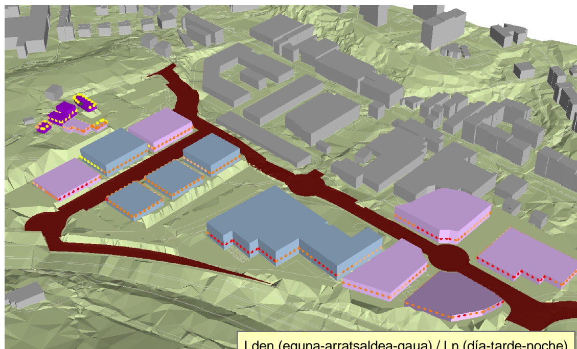
Lden (eguna-arratsaldea-gaua) / Ln (día-tarde-noche)