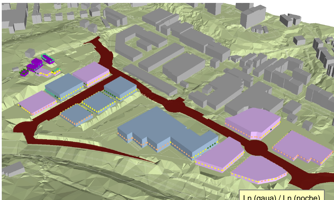
Ln (gaua) / Ln (noche)