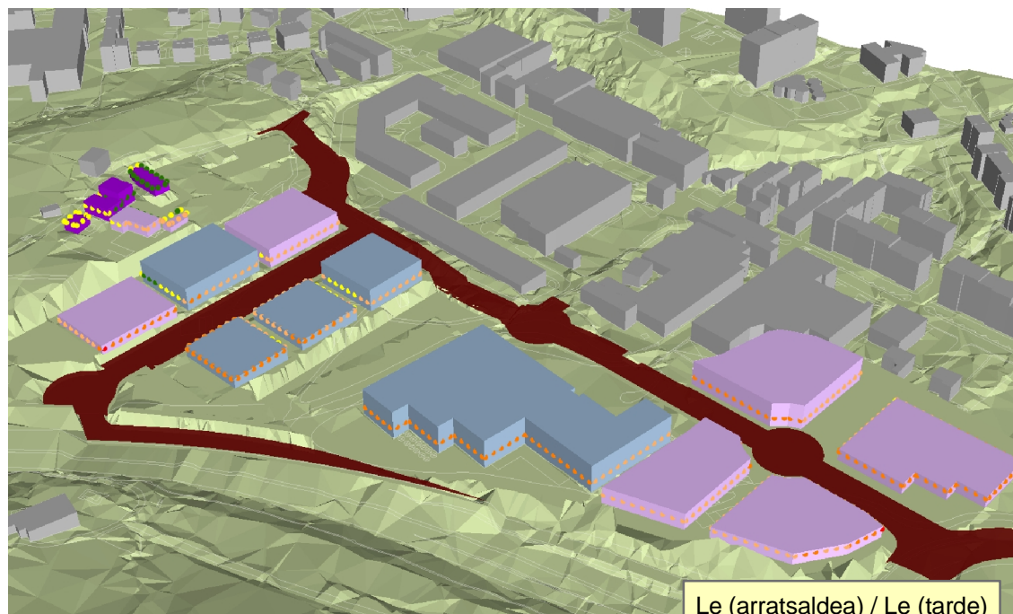
Le (arratsaldea) / Le (tarde)